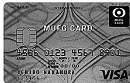
(B) 会員UFJクレジットカード(持参は不要)