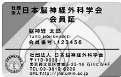
(A) 一般社団法人日本脳神経外科学会会員証

「一般社団法人日本脳神経外科学会会員証」を用いて、参加費のお支払い・専門医クレジットのご登録が出来ます(一般社団法人日本脳神経外科学会会員のみ)。